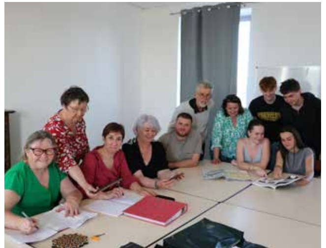
Le bureau de la commission Allemagne

La Commission Allemagne du Comité de Jumelage organise un échange du 10 juillet (départ vers 17h30) au 19 juillet 2026 (retour vers 15h) avec la ville jumelée depuis 1986 de Kosel (Nord de l'Allemagne).