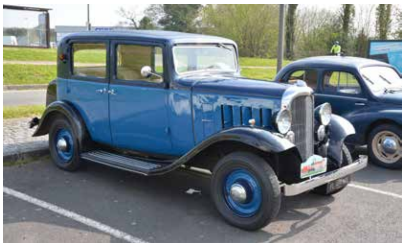
Dans le cadre du salon des collectionneurs, on a pu admirer sur le parking du collège une exposition de voitures anciennes par l'association des Anciennes Mécaniques