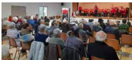
Concert animé par le groupe Tempo à Dingé pour Noël

Ces moments participent au bien-être, au maintien du lien social et à la dynamique du groupe.