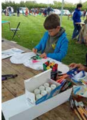
En pleine customisation de T-shirts au festival « du bruit dans la cambrousse »

Autre moment marquant : la participation à la Roazhon E-Cup à Saint-Grégoire les 22 et 23 avril. Lors de la première journée, les jeunes ont exploré l'univers du jeu rétro, rencontré une autrice jeunesse, Lucie