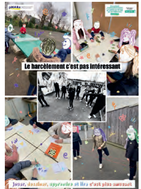
Affiche réalisée par les enfants accompagnés par Lauriane, pour le concours Phare.

Tout au long de l'année, les enseignants et les animateurs de la pause méridienne travaillent ensemble pour un climat scolaire serein et favoriser le vivre ensemble.