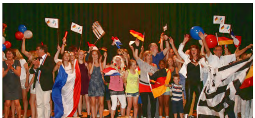
Le groupe de Koselers à La Mézière (en 2023)