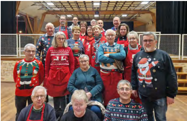
Les membres de l'association au soir du Marché de Noël

Le Marché de Noël s'installe dans le paysage Macérien