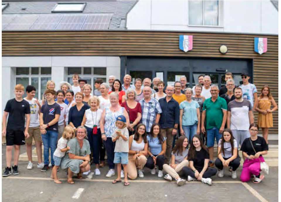
Le groupe de Macériens au départ pour Kosel (en 2022)

La Commission Allemagne du Comité de Jumelage organise un échange du 02/08/2024 (départ vers 17h30 le vendredi 02 août) au 10/08/2024 (retour vers 15h le samedi 10 août) avec la ville de Kosel (Nord de l'Allemagne) jumelée depuis 1986. Voyage en bus et hébergement en famille. Ouvert à toutes les familles Macériennes.