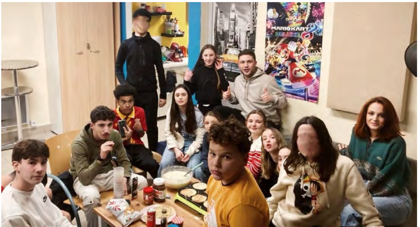
Soirée crêpes le 02 février au Macériado.

*les jeunes n'ayant pas encore 11 ans peuvent s'inscrire au Macériado pendant l'été qui précède leur entrée en 6 ème .