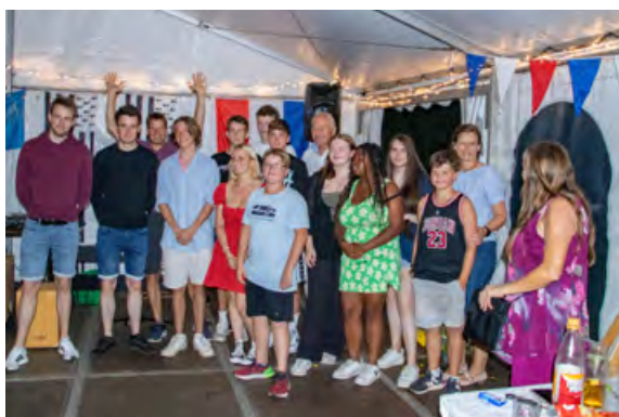
Un groupe de jeunes allemands (en 2022)