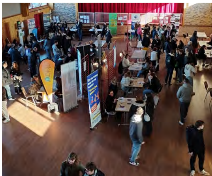
Photo prise lors de l'édition 2023 du forum