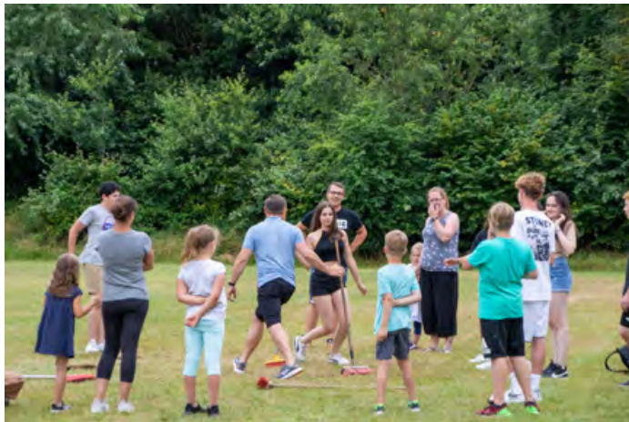
Des jeux au bord du lac de Kosel (en 2022)