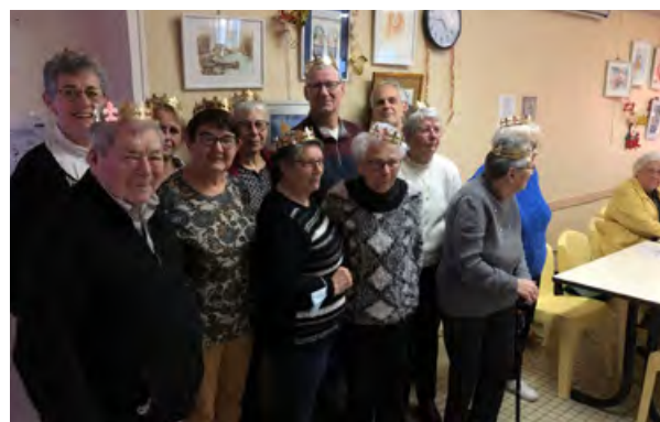
Galette des rois

Le 9 janvier 2024, 28 participant(e)s étaient présent(e)s lors du concours de Tarot.