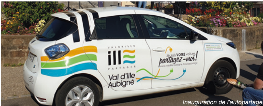
Inauguration de l'autopartage.

➤ Pour plus de renseignements, rendez-vous en Mairie.