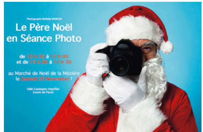
Nouveauté cette année !

À la salle Cassiopée, une quarantaine d'exposants, en métiers de bouche et artisanat de créations (pas de revendeurs) propose, à la veille des Fêtes de fin d'année : champagne, foie gras, terrines aux marrons de Redon, vins, macarons, gâteaux, chocolat, tisanes bio pour la partie alimentation et de nouveaux étals en confitures et autres produits pour les fêtes, et côté créations artisanales : des objets de décoration, couture, mode et bijoux.