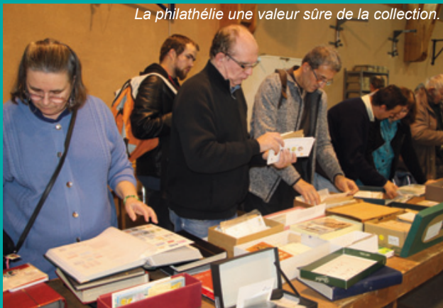
La philatélie une valeur sûre de la collection.

Pour la 28 e édition consécutive, l'association convie les collectionneurs de cartes postales, amateurs de livres et vieux papiers, de BD, de fèves, capsules de champagne, à arpenter les travées de la bourse à la recherche de l'objet convoité. Présence d'une trentaine d'exposants du Grand Ouest.