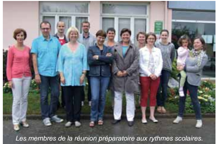
Les membres de la réunion préparatoire aux rythmes scolaires.

L'évaluation et les recommandations de ce groupe de travail seront diffusées régulièrement aux parents.