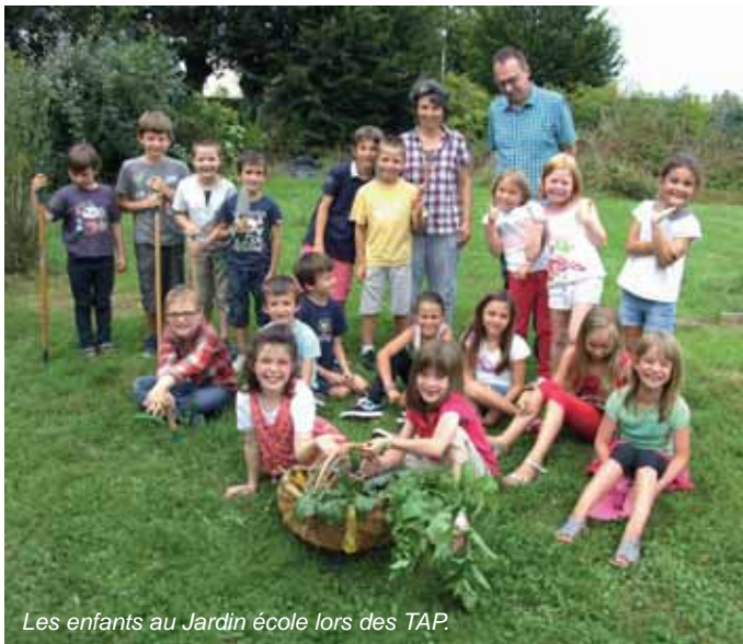
Les enfants au Jardin école lors des TAP.