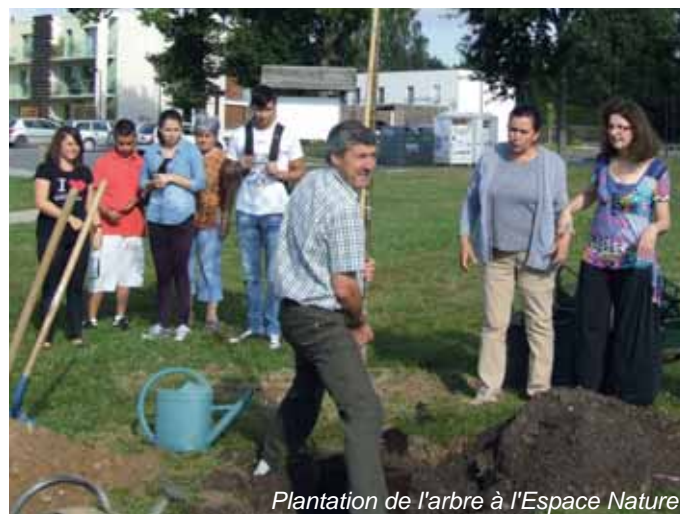
Plantation de l'arbre à l'Espace Nature