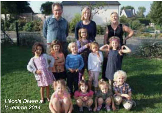
L'école Diwan à la rentrée 2014

Contact : pour renseignements et inscriptions Camille Diquelou au 06 84 84 84 73 ou diwanarmeziaer@gmail.com