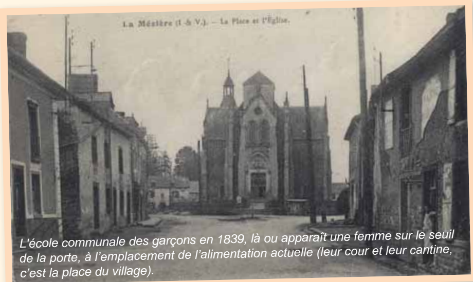
L'école communale des garçons en 1839, là où apparaît une femme sur le seuil de la porte, à l'emplacement de l'alimentation actuelle (leur cour et leur cantine, c'est la place du village).