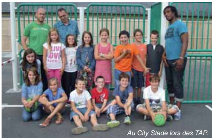
Au City Stade lors des TAP.

Cette organisation a été privilégiée pour limiter la fatigue des enfants les plus jeunes en évitant les déplacements. Tous les déplacements d'enfants (notamment les plus âgés) seront encadrés par les équipes d'animation et sous la responsabilité d'adultes.