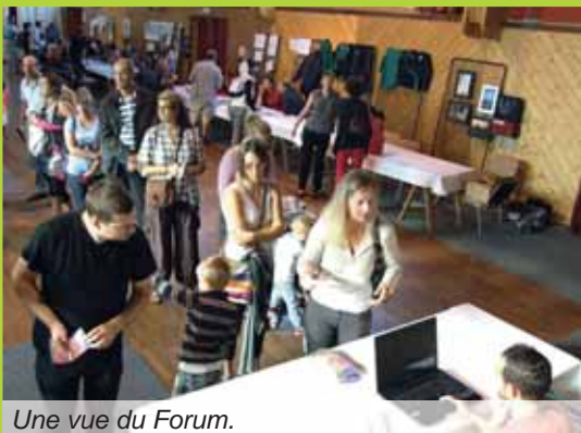
Une vue du Forum.

Un annuaire des associations est disponible au secrétariat de l'hôtel de ville pour les nouveaux habitants. Les Macériens ont reçu l'annuaire 2014-2015 avec le bulletin municipal de juillet dernier.