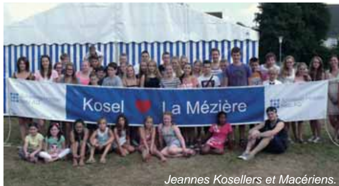
Jeunes Kosellers et Macériens.