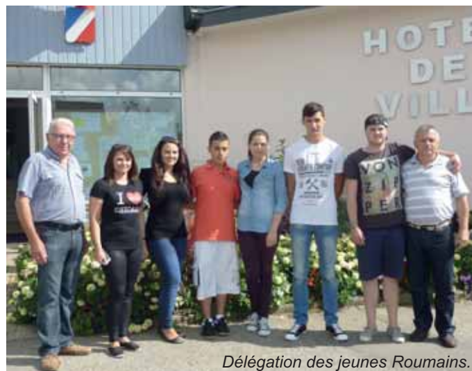
Délégation des jeunes Roumains.

La cérémonie officielle s'est déroulée à l'hôtel de ville à 11h. Gérard Bizette a mis l'accent sur toute l'importance de la présence des adolescents « 6 jeunes qui plus tard, je l'espère, prendront le relais du jumelage ». Le maire de Birghis a tout simplement répondu « nous sommes venus ici comme dans une famille ».